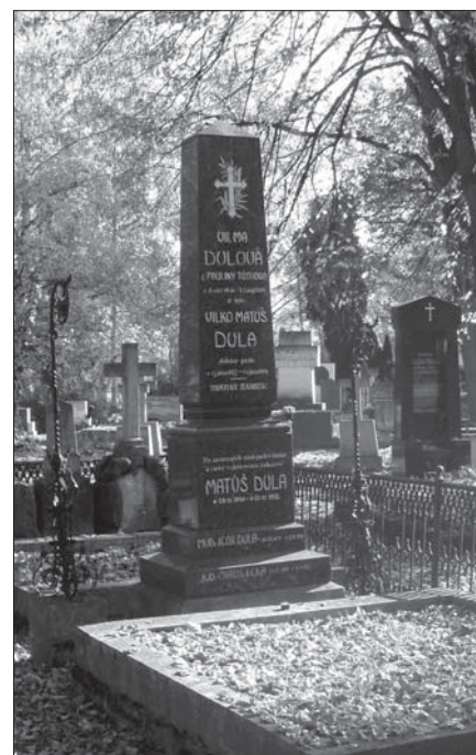
Pomník Matúša Dula na Národnom cintoríne v Martine