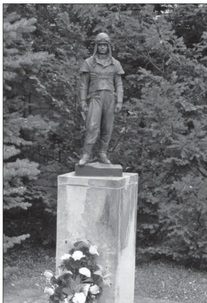
Socha M. R. Štefánika na nádvorí múzea v Košariskách

Títo traja muži si spolu vytýčili za cieľ rozbitie Rakúsko – uhorskej monarchie a vytvorenie spoločného štátu Čechov a Slovákov. Štefánik vďaka tomu, že ako letec robil výzvedné lety, rozvinul agitáciu medzi slovenskými a českými vojakmi na srbskom fronte. Vytvoril tak základ československého legionár-