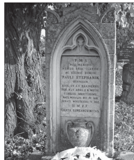
Pomník starých rodičov M. R. Štefánika na cintoríne v Krajňanom