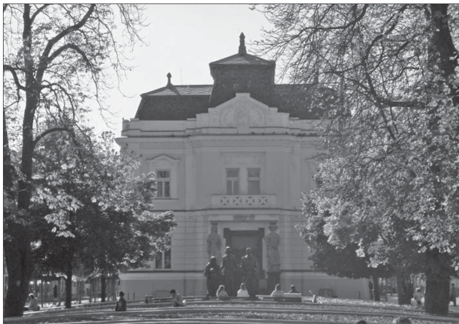
Budova Tatrabanky v Martine, v ktorej bola prijatá Deklarácia slovenského národa